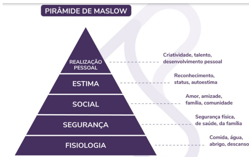
Figura 3 – A Pirâmide de Maslow