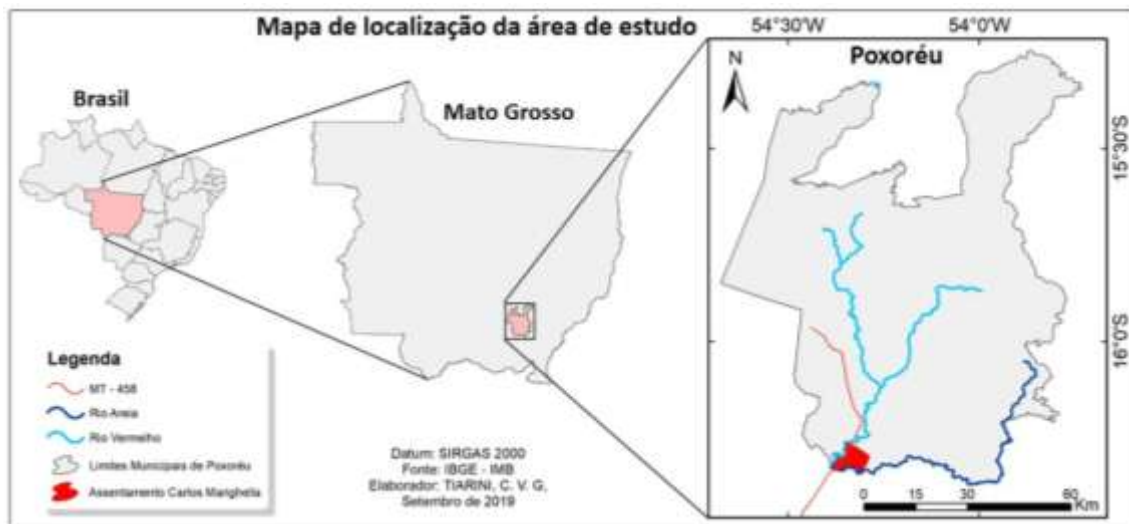
Mapa 1 – Localização de Poxoréu e do Assentamento Carlos Marighella

A primeira área de estudo desta pesquisa é o Assentamento Carlos Marighella, que é o local onde começa o circuito espacial de produção e circulação da mandioca. O assentamento está localizado a 73,1 km de distância de Poxoréu (via MT-458), às margens da MT-458, distrito de Jarudore, na zona rural do município de Poxoréu, próximo à confluência entre os rios Vermelho e Areia ( Mapa 1 ).