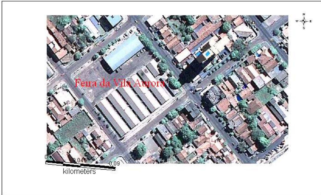
Mapa 2 – Localização da Feira Livre da Vila Aurora