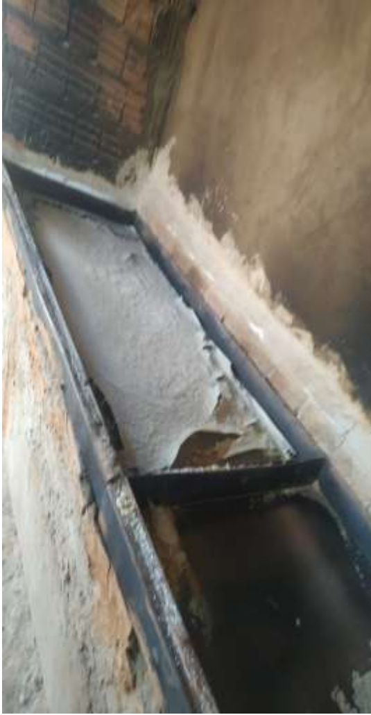
Foto 3 - Torragem da massa de mandioca