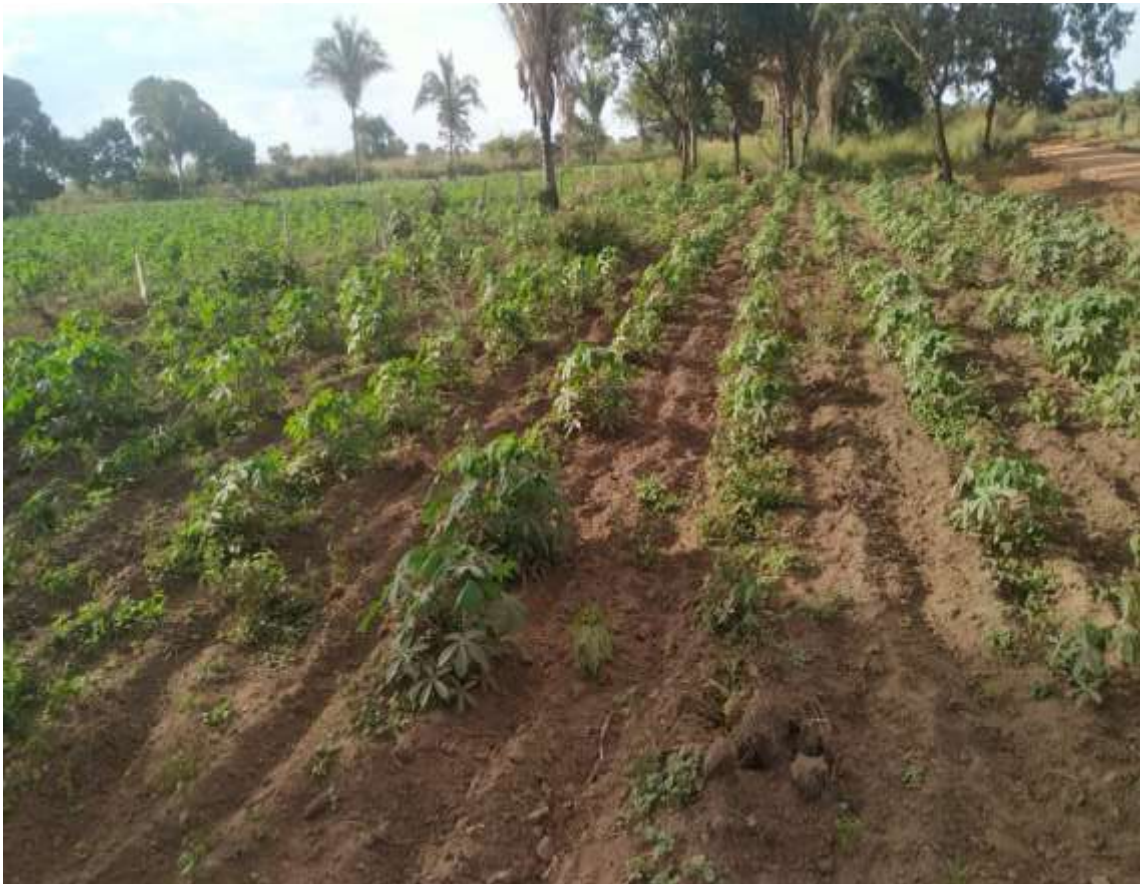
Foto 1 - Plantação de Mandioca no Assentamento Carlos Marighella Org. OLIVEIRA. I. Dados coletados em trabalho de campo, 05/2021.

Essa contratação de mão de obra de terceiros no cultivo da mandioca foi detectada em nosso estudo no Assentamento Carlos Marighella. Um dos produtores de mandioca entrevistados relatou que “pago duas pessoas e duas diárias a terceiros para realizar a plantação da mandioca, cuidar da plantação e fazer a colheita das ramas de mandioca” ( Foto 1 ).