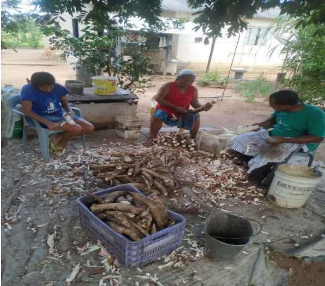
Foto 2 - Membros de uma família de produtores de farinha de mandioca realizando o descascamento manual da mandioca no Assentamento Carlos Marighella

Org. OLIVEIRA. I. Dados coletados em trabalho de campo, 05/2021.