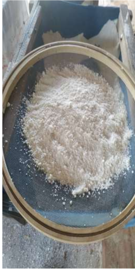
Foto 4 - Peneiramento e esfarelamento