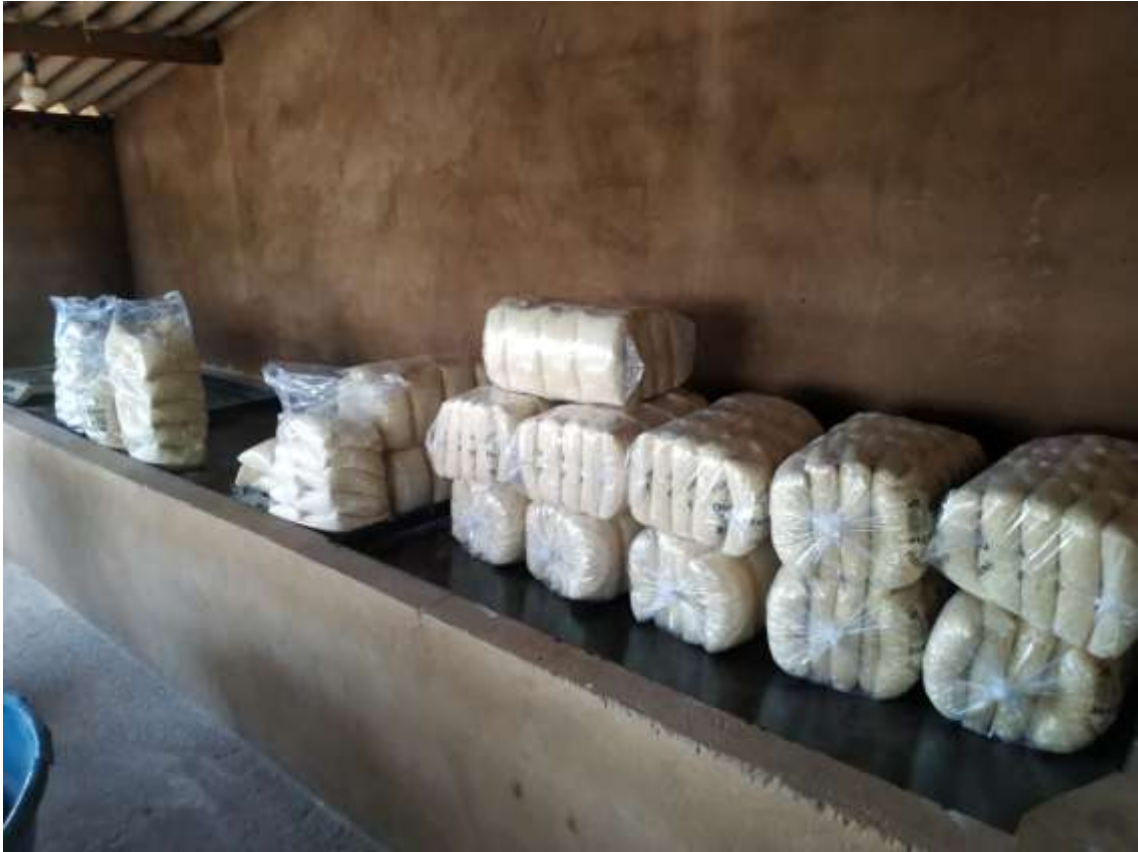
Foto 5 - Estocagem e armazenagem de farinha de mandioca no Assentamento Carlos Marighella Org. OLIVEIRA. I. Dados coletados em trabalho de campo, 05/2021

No Quadro 5 , exibimos alguns dados coletados no estudo de campo que explicam como é feito o transporte e a comercialização da mandioca e da farinha no Assentamento Carlos Marighella.