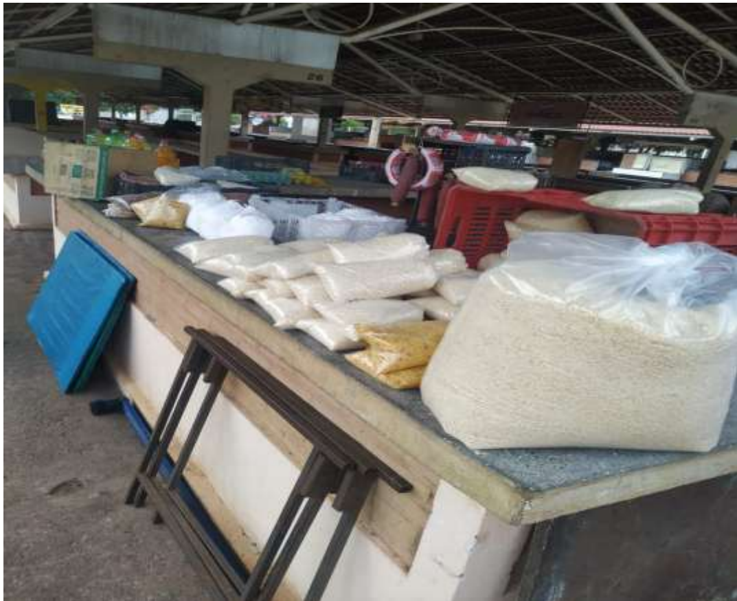
Foto 7- Comercialização de farinha na feira livre da Vila Aurora, Rondonópolis-MT Org. OLIVEIRA. I. Dados coletados em trabalho de campo, 05/2021

Nas feiras livres da Vila Aurora, durante o estudo de campo in loco , observamos que o comércio de mandioca in natura é muito pequeno se comparado ao consumo de farinha que é maior.