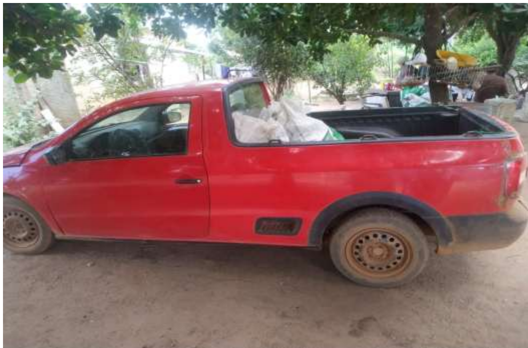
Foto 6 - Veículo particular que é transportado a mandioca do Assentamento Carlos Marighella Org. OLIVEIRA. I. Dados coletados em trabalho de campo, 05/2021

Conforme o Quadro 5 , dos produtores de mandioca entrevistados, a maioria absoluta, 05 (cinco), ou seja, 100% responderam que utilizam carros particulares ( Foto 6 ) para efetuar o transporte da mandioca in natura e da farinha.