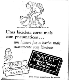
Fonte: "O Brado Africano", edição 1414, Ano XXXIII, publicado em 23/12/1950.

Ademais, a inteligibilidade das línguas moçambicanas poderia gerar um processo de apropriação de sentidos e naturalmente uma delas ganharia maior destaque. O Emakwa, por exemplo, constitui até hoje a língua com mais falantes nativos em Moçambique e é a única usada em várias províncias do país, nomeadamente, Nampula, Zambézia, Niassa e Cabo Delgado, e poderia potencialmente se fazer um investimento para que esta língua fosse de ensino e comunicação entre os membros.