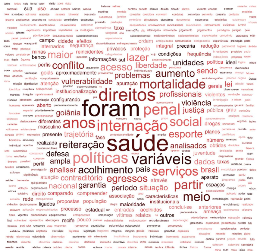
Figura 6 - Nuvem de palavras gerada a partir dos 07 artigos da área de Direito.