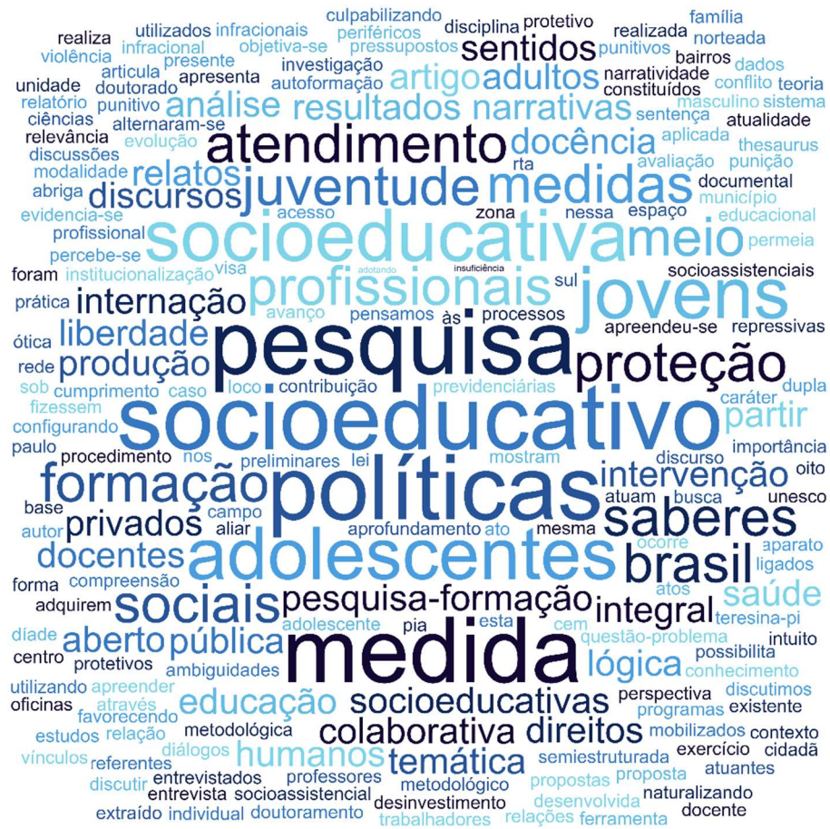
Figura 10 - Nuvem de palavras gerada a partir da categoria de análise junto aos trabalhadores.