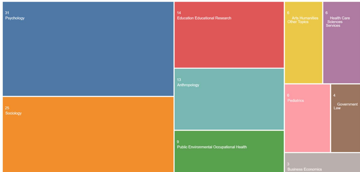
Figura 2 - Distribuição da produção por áreas do conhecimento (n=84).

campo da educação? Abaixo, como forma de auxiliar a visualização da distribuição destas produções encontradas pelas áreas do conhecimento elencadas, apresento uma figura extraída de uma das ferramentas analíticas da plataforma Web of Science , em que se representa a distribuição por meio de um gráfico em imagem.