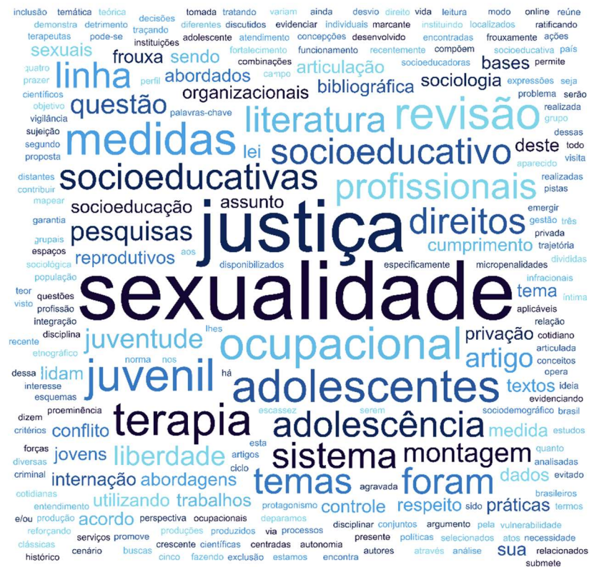
Figura 11 - Nuvem de palavras gerada a partir da categoria de revisão bibliográfica.