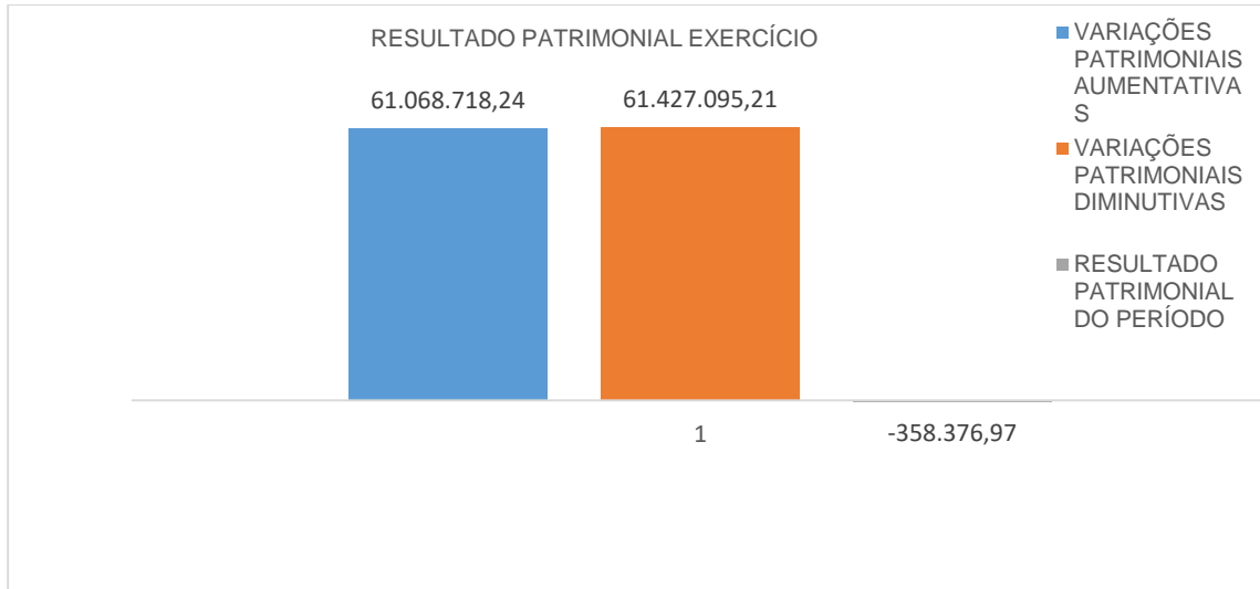
Gráfico 2. Resultado Patrimonial de 2024

No segundo trimestre de 2024 o resultado patrimonial foi deficitário no valor de R$358.376,97 (trezentos e cinquenta e oito mil, trezentos e setenta e seis reais, e noventa e sete centavos), este valor compõe o Balanço Patrimonial, conforme consta na Nota 8.