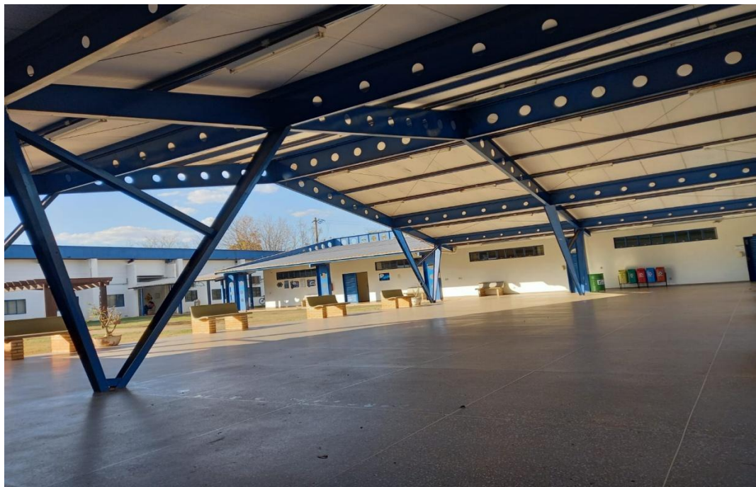
Figura 01: Foto do Bloco da Psicologia (área de ambiência para estudantes)