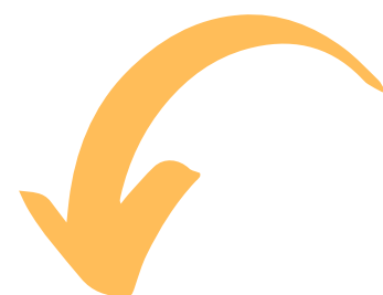
Disciplinas Ofertadas em 2026/1 – Turma do 1º Semestre Letivo (Turma 2026)