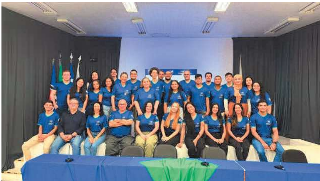
Vídeo curto do evento: Link